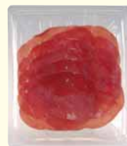
busta in atmosfera protettiva

Pezzatura / cut size: da 3 a 4 kg / 3 to 4 kg