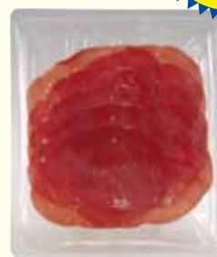
busta in atmosfera protettiva